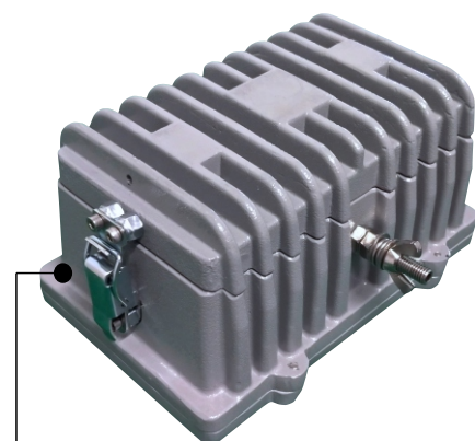
Fecho lingüeta regulável