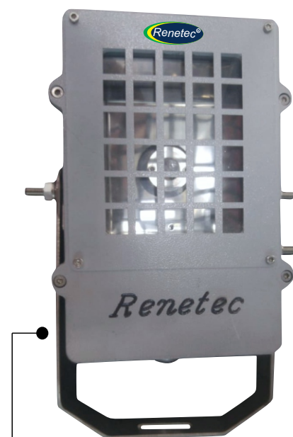
Alça de fixação