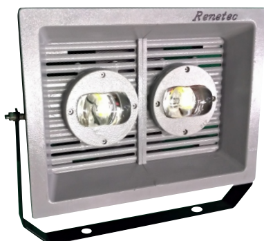
100W e 150W